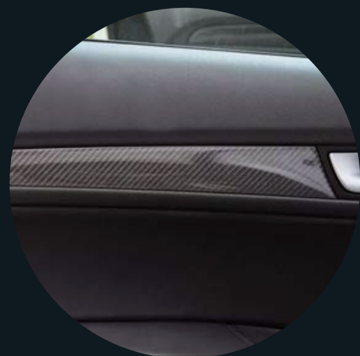
/ Дверные панели