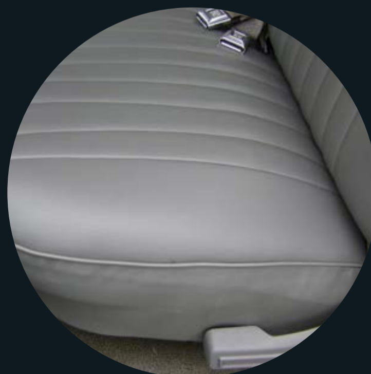
/ Кожаные элементы сидений