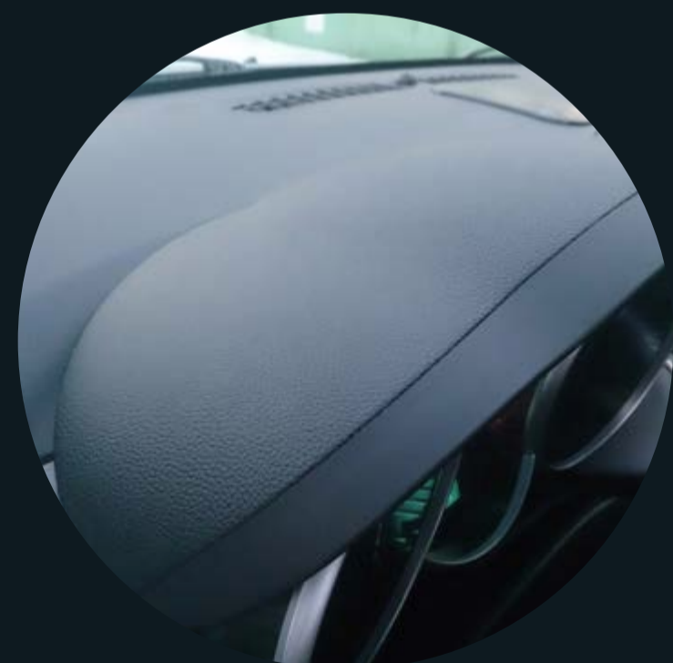
/ Козырьки панелей приборов